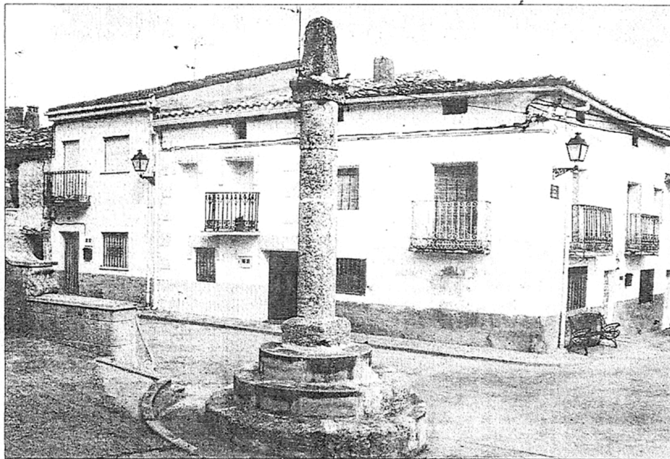
La picota de La Toba.