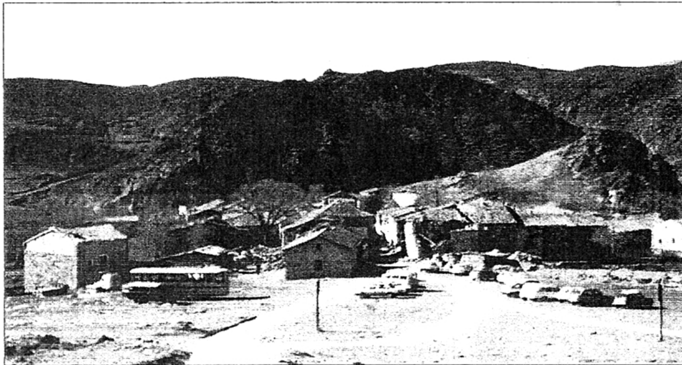
Alcorlo en el inicio de la demolición.

Por fin, en la mañana del jueves 28 de enero de 1982, casi cien años después de que se comenzase a hablar de la desaparición del pueblo de Alcorlo tragado por las aguas, las máquinas excavadoras entraron en sus calles con objeto de demoler las casas que quedaban en pie. Previamente se remitió una comunicación a la Alcaldía en