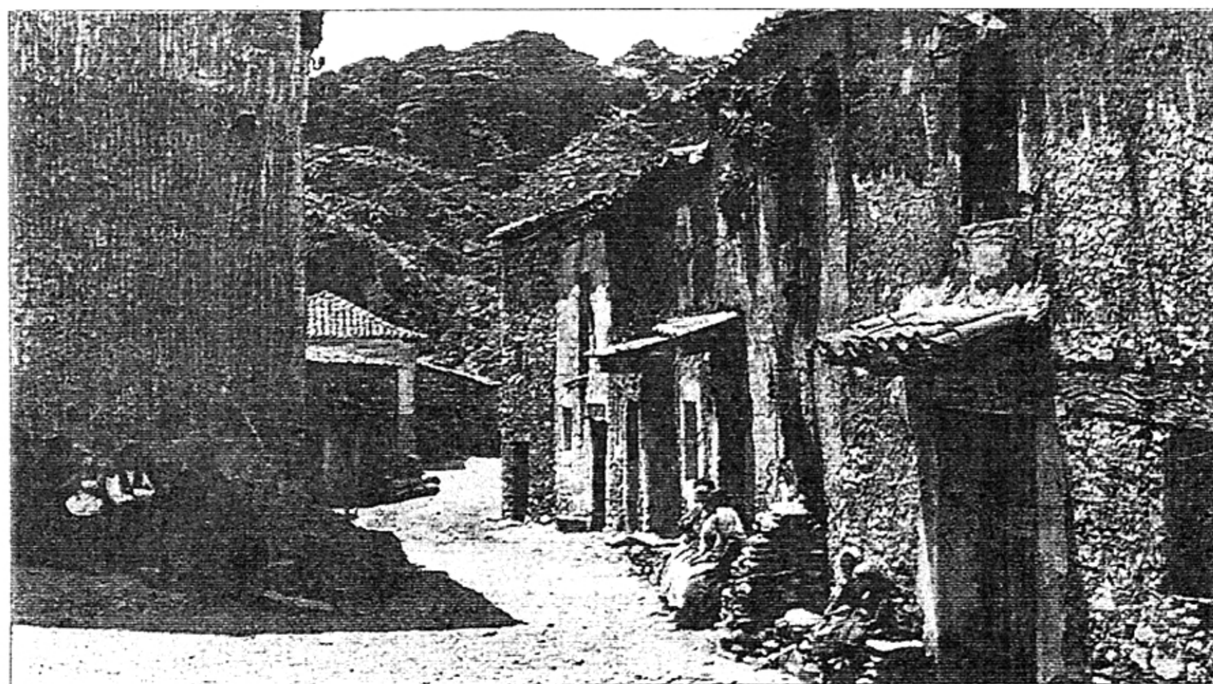
Una calle de Alcorlo, hacia 1930.

funciones en la que se significaba que para el día 27 de enero se hacía imprescindible el disponer del poblado, ya que una gran parte del pueblo va a quedar por debajo de lo que van a inundar sus aguas, pensando que, en el plazo que se daba para efectuar el desalojo, la gente comprendería el problema y mediante diálogo suficiente con el Ministerio y Confederación, se llegaría a un acuerdo para desalojar.