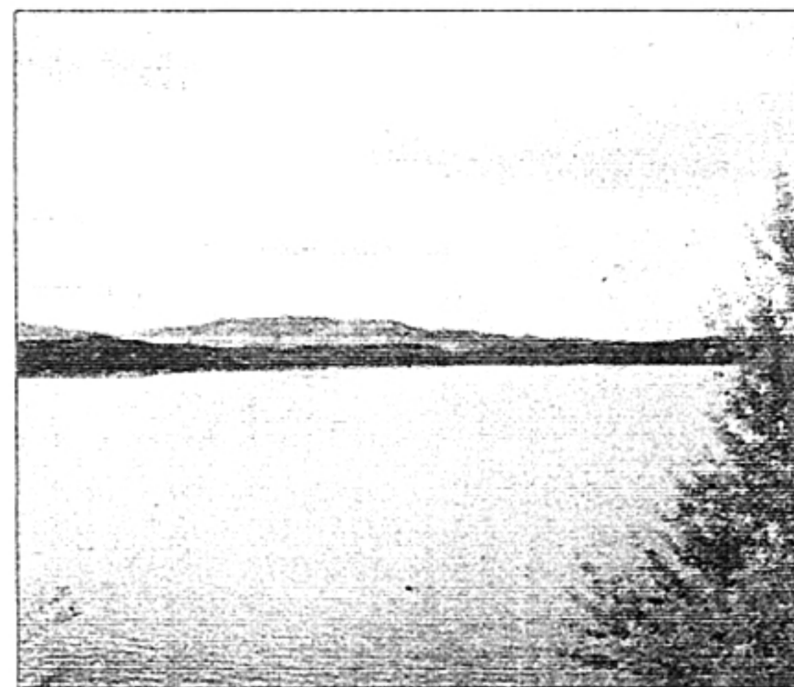
Bajo las aguas duerme la historia de Alcorlo.